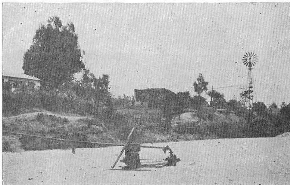
Fotg. 1. Un sistema original para el riego en El Prado, distrito de Loica. La foto fue hecha a fines de enero, cuando el estero del primer plano estaba completamente seco. Un agricultor ha excavado un pozo en el lecho arenoso, y lo reforzó con paredes de cal y canto. El pozo tiene una profundidad de aproximadamente un metro y medio, y en su fondo se acumula agua que corre por las arenas permeables aun en esta temporada. De allá la pequeña bomba de gasolina la saca. Durante el invierno lluvioso el dueño tapa el pozo con un bloque de cemento para protegerlo. Se puede observar su vivienda a la izquierda y una noria de viento a la derecha.