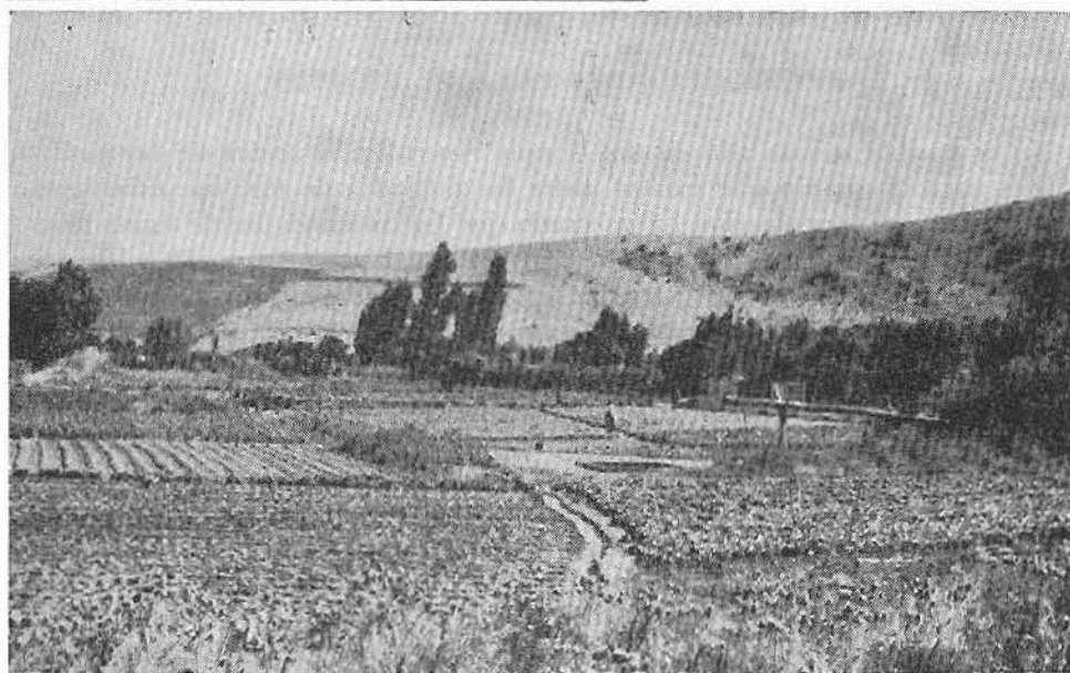
Fotg. 5. La zona de la producción comercial de la hortaliza en el distrito de Lo Abarca, poblado de Lo Zárate. El cardo de Castilla en el primer plano y los cerros áridos constituyen un fuerte contraste con las productivas tierras llanas y regadas en el fondo del pequeño valle. Los solares, dedicados aquí principalmente a las lechugas y cebollas, cubren apenas cien metros cuadrados cada uno. Son regados con bombas de gasolina, una de las cuales está ubicada en la maleza visible hacia la izquierda del centro de la fotografía.