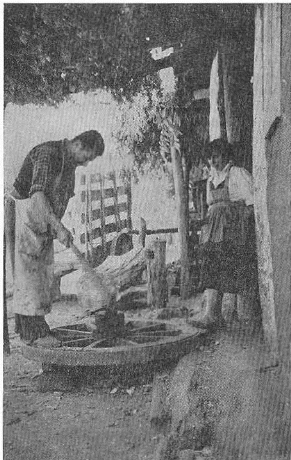
Fotg. 4. Un agricultor-artesano y su esposa en la villa de San Pedro de Alcántara. Este hombre completa su ingreso de la agricultura como herrero, y además fabrica arados y ejes y ruedas para las carretas de sus vecinos. En esta fotografía está terminando una rueda nueva con su azuela. Usa como materia prima las maderas autóctonas como el espino y el peumo.