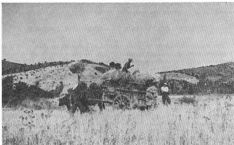
Fotg. 3. La cosecha del trigo en el distrito de Cuncumén a principios de febrero. Se está cargando una carreta tirada por bueyes con el trigo seco, utilizanse crudas horcas de ramas. El rastrojo se quedará hasta que las ovejas puedan forrajear, y después será arado antes de pasar un período como barbecho. Al fondo se ven otros trigales en las laderas.

El dueño-cultivador y su familia necesitan saber de gran variedad de técnicas. El mismo hombre es criador, ganadero y también sembrador, debe conocer de la selección de la semilla, del cultivo de secano y de las técnicas de riego; debe ser carpintero y debe saber lo suficiente sobre el comercio para vender sus productos al mejor precio (ver Fotg. 4). El campesino poseedor de tal variedad de habilidades tiene cierta adaptabilidad y flexibilidad en el manejo de su finca, comparado con un sistema de monocultivo comercializado.