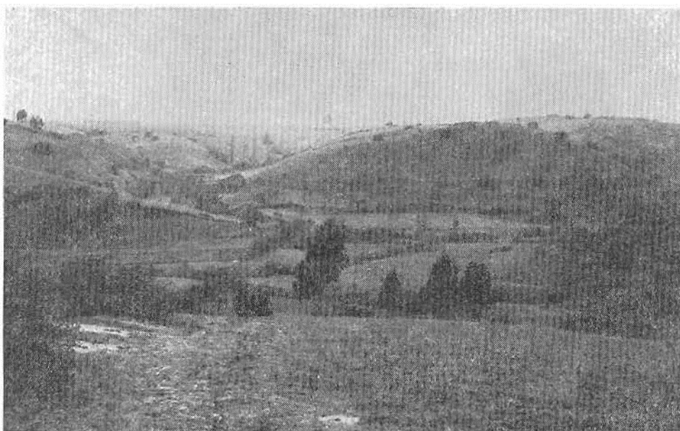
Fotg. 2. Un paisaje de la llanura costera en el distrito de San José durante una llovizna invernal. Casi toda la vegetación natural de esta área fue exterminada hace un siglo o más. Los dueños-cultivadores utilizan aquí una rotación entre los cereales, el barbecho y el pastoreo. Los pocos árboles en el centro pertenecen a una cerca viva de eucaliptos. En el fondo del valle se pueden observar unos álamos a lo largo de los meandros del pequeño estero. Valle abajo, hacia la izquierda se ve la casa de una finca familiar.

Otro tipo de origen es el de los poblados que fueron establecidos por gente humilde, quienes emigraron a tierras nuevas en tiempos coloniales o republicanos. El distrito de San José fue habitado ya por el año 1580 por soldados españoles. Sobre aquéllos se sabe únicamente que tenían cría de ganado. Significativamente fueron soldados —posiblemente desertores— y no oficiales privilegiados. En Navidad, también, soldados españoles se establecieron como agricultores hacia el fin de las guerras de la Independencia. Fueron a este sitio para refugiarse de los patriotas y encontraron un aislamiento seguro lejos del Valle Central.