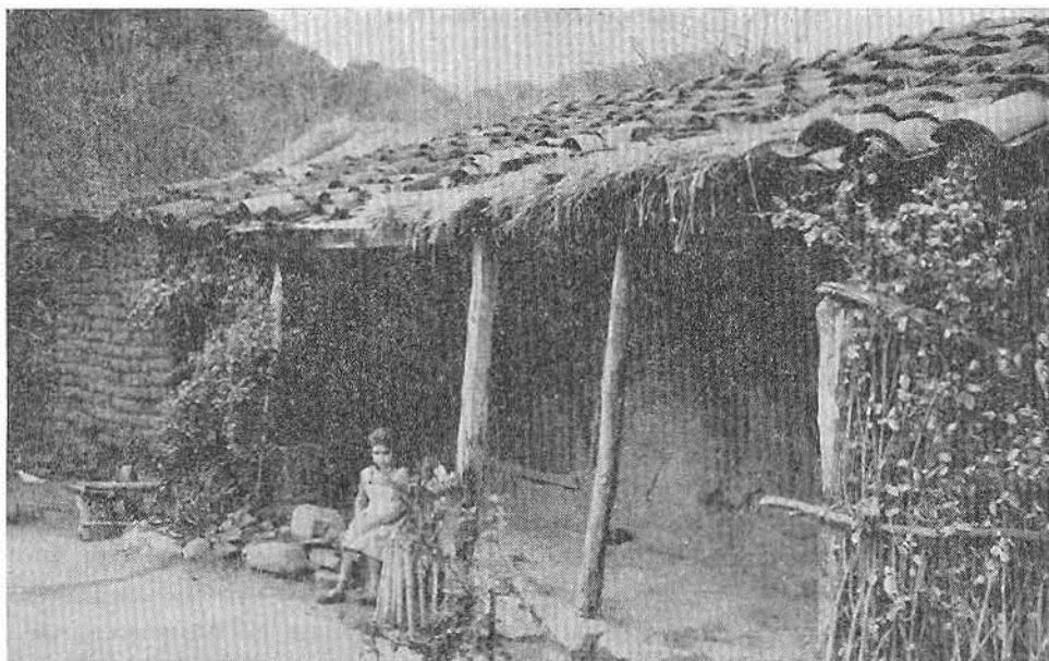
Fotg. 6. La hija de un dueño-cultivador en el corredor del frente de una humilde casa familiar en el distrito de San José. La variedad de los materiales de construcción es notable: la pared de la izquierda está hecha de adobes, la pared entre el corredor y la casa es de quincha, parte del techo es de tejas y parte es de paja. No hay ventanas y la única puerta está hecha de toscas tablas de madera.