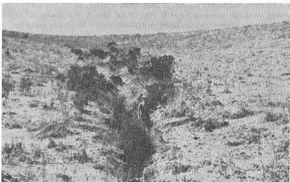
Fotg. 7. Una de las numerosas cárcavas que se encuentran en los pastos y trigales del distrito de Lo Abarca. Como se ve, la erosión es avanzada pero no se ha hecho gran esfuerzo de detenerla con la siembra de árboles o con el uso de estacadas transversales. Esta cárcava tiene una profundidad de unos cinco metros en algunos lugares.